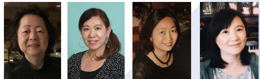
シカゴからの参加者の皆さん(予定)

☆詳細・申込は、チラシかホームページ ( http://danjo.osaka.jo ) をご覧ください。☆