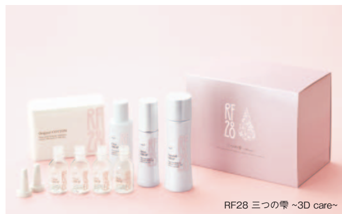
RF28 三つの雫 ~3D care~

また、社員一人ひとりがいきいきと働ける社内制度を充実させ、社員一丸となって、社会のお役に立てる企業を目指し、様々な角度から人々の生活のうらおいに貢献できるような総合的な「美の文化」を創造する企業グループを目指します。