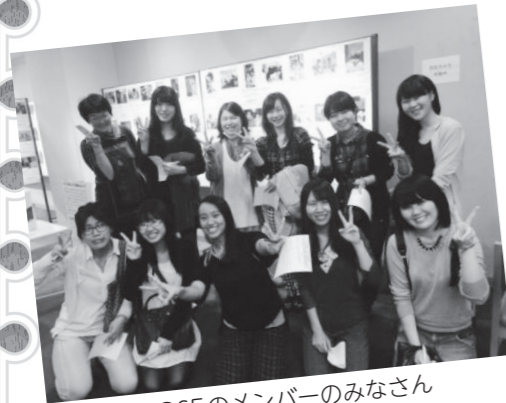
ROSEのメンバーのみなさん

一つのイベントを取りまとめたことは私の人生の中で初めての取り組みでしたが、メンバーや先生方、クレオ大阪南のみなさんのフォローなくしての実現は難しかっただろうと思います。私にとって一番の学びは、関わる人々に感謝をすることの大切さです。これから先、社会人となっても大切な教訓として活かしていきたいと考えています。