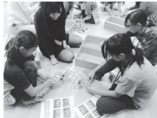
しゃくとり虫ロボットの組み立てに挑戦！