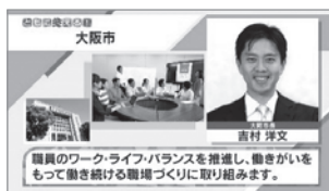
大阪市長による宣言