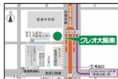
Osaka Metro 谷町線「喜連瓜破」駅下車