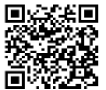
子育て館ホームページ QRコード