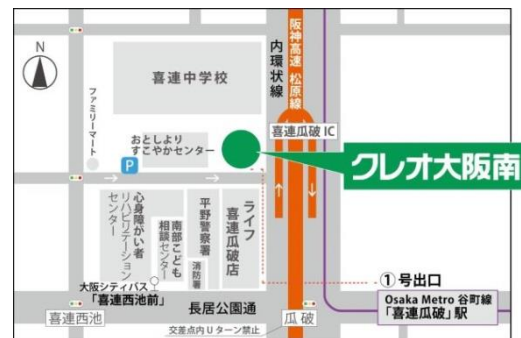
■Osaka Metro 谷町線「喜連瓜破」駅下車 ①号出口から北西へ 徒歩約5分

※新型コロナウイルス感染症拡大予防のため、マスクの着用や手洗い、うがいの徹底をお願いします。 また、体調の悪い方はご参加をご遠慮ください。 当館では、アルコール消毒液の設置、会場の換気、プログラム内容の変更などの対策と配慮を行い開催いたします。 また、状況により、延期・中止させていただく場合もございますので、ホームページなどでご確認くださいませよう、ご理解とご協力をよろしくお願いいたします。